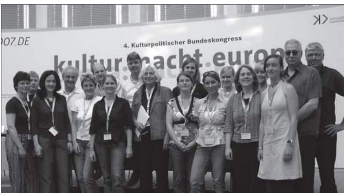
Organisationsteam im Foyer der Friedrich-Ebert-Stiftung in Berlin

Der Vierte Kulturpolitische Bundeskongress war damit sowohl von der Teilnehmerzahl als auch von der Mischung der Teilnehmer ein voller Erfolg. Gelingen ist dies u.a. auch durch die Koppelung des Kongresses mit einem Treffen der europäischen Cultural Contact Points und der deutschsprachigen Kulturpolitikforscher