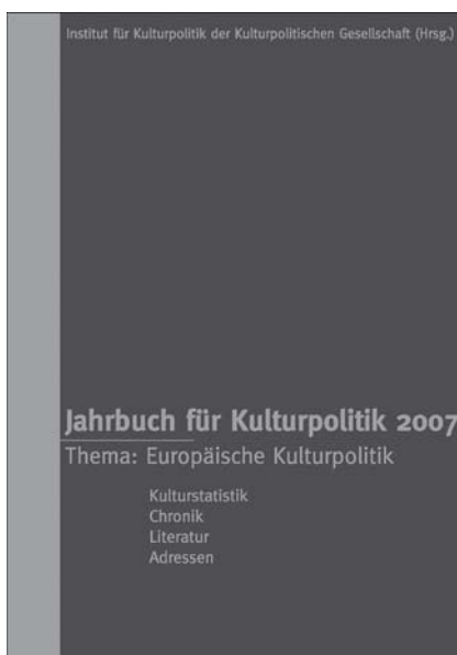
Institut für Kulturpolitik der Kulturpolitischen Gesellschaft (Hrsg.): Jahrbuch für Kulturpolitik 2007. Band 7, Thema: Europäische Kulturpolitik , Essen: Klartext Verlag 2007, 485 S., ISBN 978-3-89861-853-3, 19,90 Euro