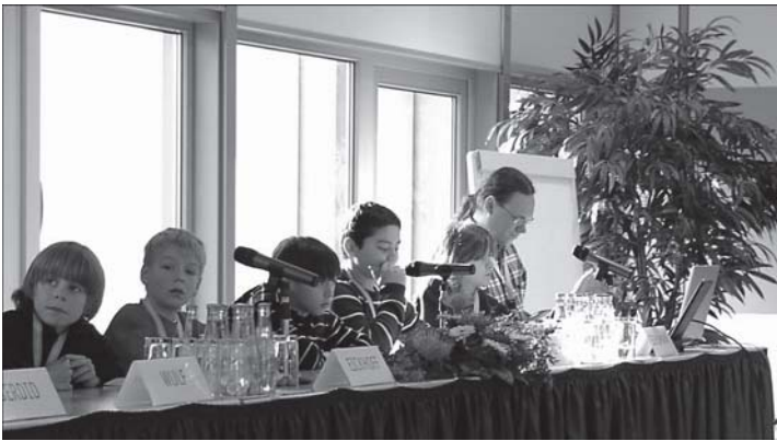
come_IN: Interkultureller Computerclub, Bonn/Siegen

Der zweite und letzte Tag der Tagung sollte vor allem der Kulturpolitik und ihrer interkulturellen Programmierung gehören. Allerdings gab es hier aufgrund des Bahnstreiks einige personelle Veränderungen im Programm, so dass improvisiert werden musste. Im Nachhinein war diese Improvisation durchaus kein Nachteil, hat sie doch die Gelegenheit eröffnet, mit dem Publikum stärker als sonst üblich ins Gespräch zu kommen. Die Diskussion griff dabei im Wesentli-