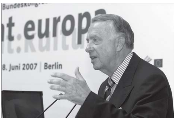
Bernd Neumann, Staatsminister für Kultur und Medien

Adressaten des Kongresses waren Kulturakteure, Kulturpolitiker und Kulturwissenschaftler in ganz Europa. Der Bundeskongress sollte zunächst die bundes-