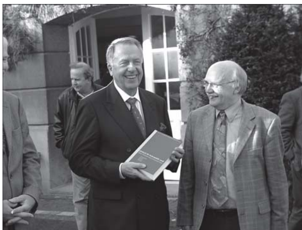
Staatsminister für Kultur und Medien Bernd Neumann im Haus der Kultur in Bonn.

der Ausbildung für kulturvermittelnde Tätigkeiten. Mit der Kulturwirtschaft und dem kulturpolitischen Umgang mit Geschichte sind zwei neue Arbeitsfelder hinzugekommen.