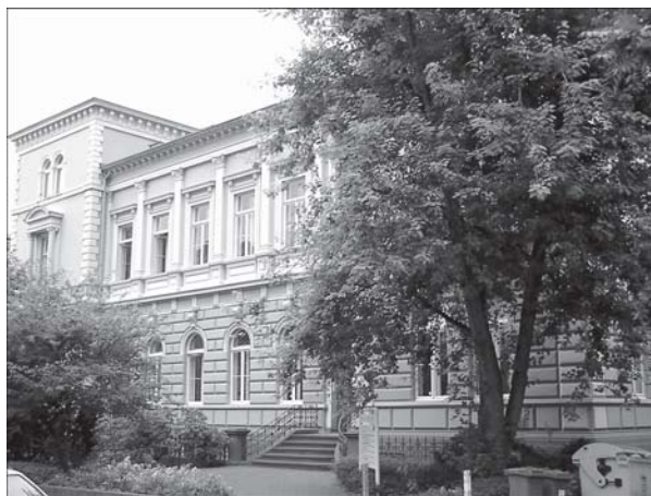
Sitz des Instituts für Kulturpolitik: das »Haus der Kultur« in Bonn

Im Vergleich mit anderen europäischen Ländern liegt Deutschland mit Blick auf wissenschaftliche Forschungsarbeiten im Kulturbereich weit zurück. Auch im Vergleich mit anderen Politikfeldern verfügt die Kulturpolitik über keine ausreichend entwickelte Forschungsinfrastruktur. Es gibt vielmehr einen Nachholbedarf an fundierten Recherchen